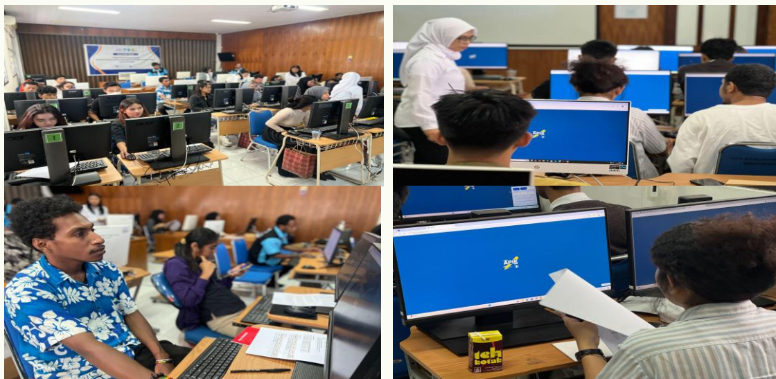
Gambar 2. Kumpulan Dokumentasi Kegiatan

Tahap akhir dari prakter yang dilakukan adalah melihat laporan yang dihasilkan dari pengelolaan keuangan usaha menggunakan SIAPIK. Laporan yang dihasilkan, yaitu Laporan Posisi Keuangan (Neraca), Laporan History Transaksi, Laporan Rincian, Laporan Kinerja Keuangan, Laporan Laba Rugi dan Saldo Laba, Laporan Trend, Laporan Arus Kas, dan Laporan Analisis Beban Usaha Tahunan.